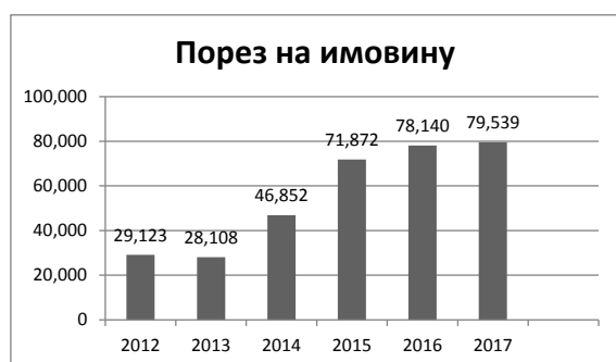
Кретање појединих изворних прихода у периоду 2012-2017 (јан-септ)