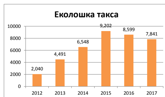
Кретање појединих уступљених прихода у периоду 2012-2017 (јан-септ)